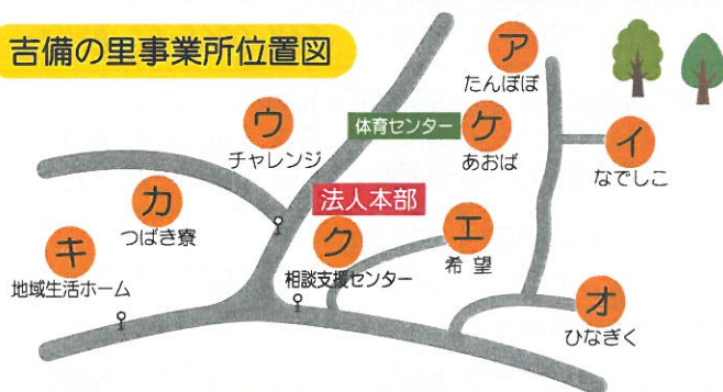
吉備の里事業所位置図

当法人は、自然そして多くの社会資源を最大限に活かしたカリキュラムを実践し、“利用者いつまでも健康で生活してほしい”を基本に、「余暇」「食事」「健康」面について家庭的な現場で支えます。