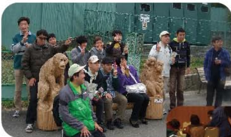
研修旅行 (福山動物園)