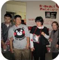
カップヌードル発明記念館