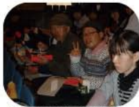
なんばグランド花月

2日目はインスタントラーメン発明記念館を見学。好きな具材やスープをトッピングし、世界で1つだけのマイカップヌードル作りを体験できた。どんな味のカップヌードルが食べられるのか楽しみに持ち帰った。