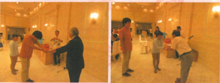
家族の会納涼祭にて目録贈呈

吉備の里家族の会様より、運動会綱引き用のロープを寄贈いただきました。併せて、地域生活ホーム事務所新設に伴い、寄付金10万円をいただきました。